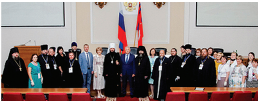
Фото 2. Заседание конкурсной комиссии межрегионального этапа в Волгоградской областной Думе под председательством Митрополита Волгоградского и Камышинского Феодора.

Приглашаю волгоградских педагогов к участию в важном и нужном для современного российского образования Конкурсе. Желаю всем благословенных трудов на ниве педагогического служения и творческих успехов.