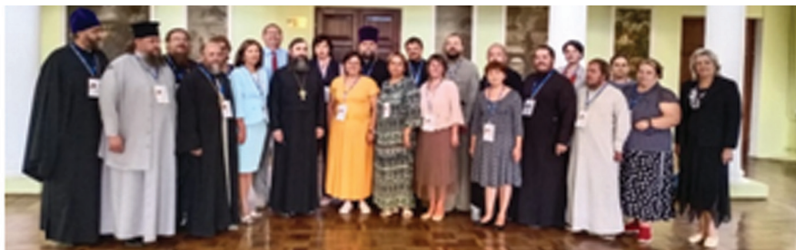
Фото 1. Члены экспертной комиссии межрегионального этапа Конкурса

верситета было организовано пребывание и работа экспертной комиссии межрегионального этапа Конкурса (фото 1).