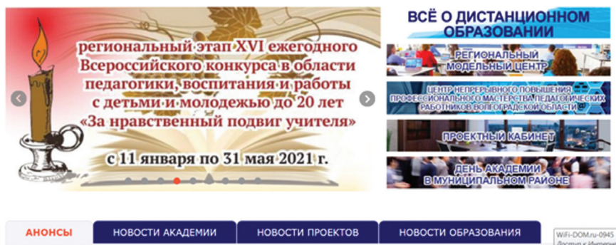
Фото 1. Информация о региональном этапе Конкурса на сайте Волгоградской государственной академии последипломного образования

На сайте Волгоградской государственной академии последипломного образования https://vgarkgo.ru/ под картинкой баннера располагается информация о региональном этапе Конкурса (фото 1).