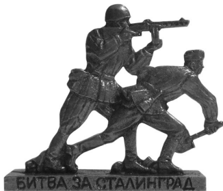
Рис. 1. «Битва за Сталинград»

Все наборы игровых солдатиков, выпущенные российскими производителями на тему Сталинградской битвы, по размеру и типу фигур можно разделить на четыре группы.